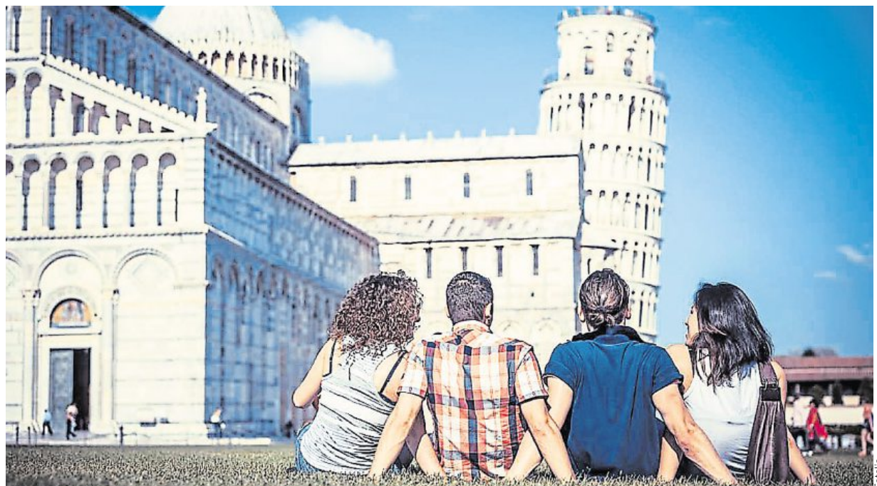
De nombreuses applications mettent en relation les voyageurs qui ne souhaitent pas partir seuls.

Vacances. Pour économiser de l'argent ou bien partager les bons – et mauvais – moments, de plus en plus de célibataires se regroupent pour voyager.